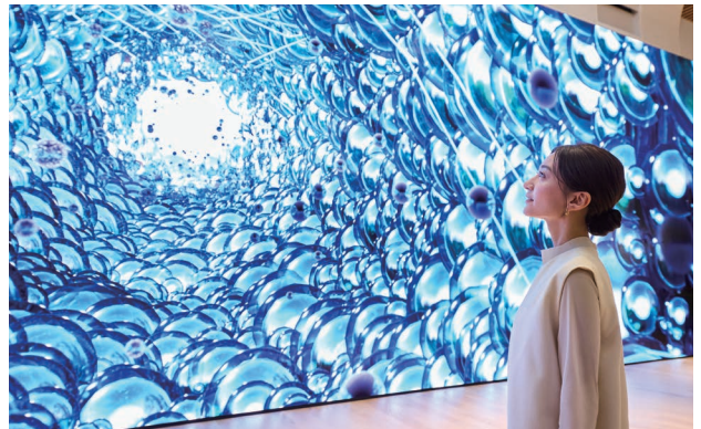
Beauty Retreat Theater